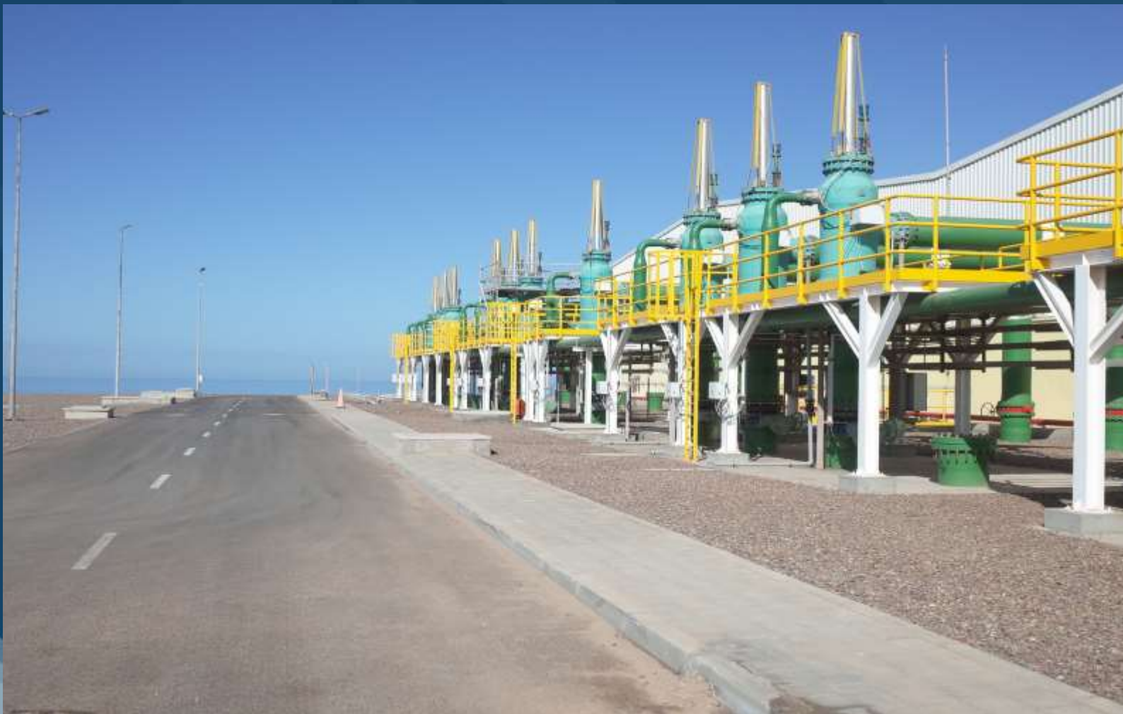
Agadir desalination plant